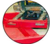
Timon de manoeuvre amovible avec passage de fourche

Portes industrielles - Equipements de quais - Maintenance - V.G.P.