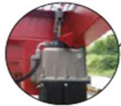
Pompe hydraulique manuelle permettant la mise à niveau de la rampe par rapport à la hauteur du camion