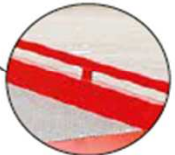
Rambardes de sécurité