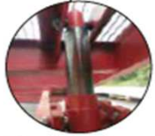
Vérins hydrauliques avec lesquels il est possible de varier la hauteur de la rampe de 900 mm à 1700 mm