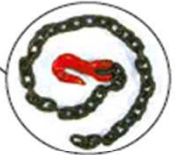
Chaînes de sécurité, longueur 2000 mm avec crochets