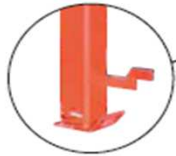
Béquilles de sécurité à broche réglables en hauteur, emplacement de rangement du Timon