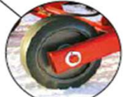
Train de roues réglable sur vérins hydrauliques, 2 roues avec bandage caoutchouc 400 x 170 mm