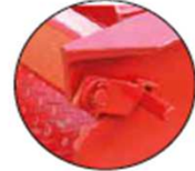
Emplacement du Timon avec loquet de sécurité