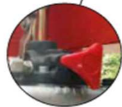
Robinet de descente Détail de la pompe