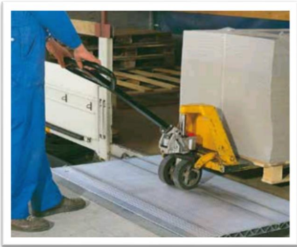
FIXATION DU RAIL KBS A SOUDER