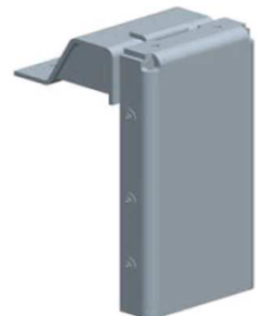
Ht 100 mm