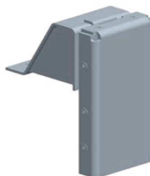
Ht 200 mm