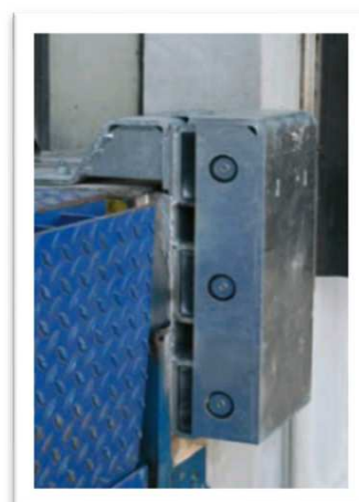
Ht 100 mm