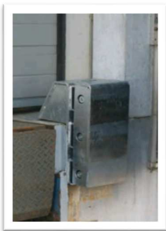
Ht 200 mm